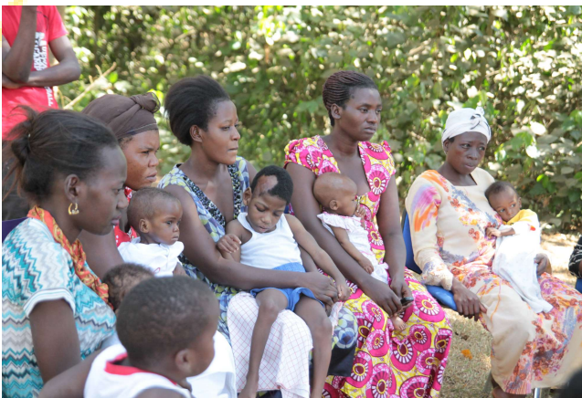
Een groep moeders met hun ondervoedde kinderen, eerst voorlichting. Daarna krijgen ze weer nieuwe plumpynut.

Net voor de kerst deden we een oproep om een extra donatie te doen t.b.v. de strijd tegen ondervoeding. Vol enthousiasme werd er op gereageerd. Tamar heeft er meteen plumpynut (speciale therapeutische voeding voor ondervoedde kinderen) van aangeschaft. De timing was perfect. De outreaches blijken zijn vruchten af te werpen, want meer en meer mensen vanuit de omliggende dorpen melden zich op tijd voor behandeling van hun ondervoedde kinderen. Het overgrote merendeel kan bovendien poliklinisch behandeld worden. Het doel van de outreaches is door middel van voorlichting voorkomen dat kinderen ondervoed raken, daarnaast screenen we actief op ondervoeding en laten we mensen weten waar ze hulp kunnen krijgen mochten dat nodig zijn. Dat laatste heeft lang geduurd, voordat mensen anderen naar ons toe verwezen. Maar inmiddels is men bekend met ons en de ondervoedingskliniek, waardoor het merendeel poliklinisch behandeld kan worden. Het is dubbel om te zeggen dat het iets goeds is dat er zoveel ondervoedde kinderen zijn. Maar met de extreme droogte van het afgelopen